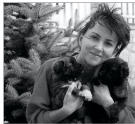
Két kiskutyájával a kertben

– Az előadókat, az előadások témáit hogyan választják ki?