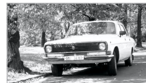
A legismertebb Volga-arculat

lyamatosan továbbfejlesztett (új orr-részek, Toyota-motorok) változatai adják. Ez mutatja a márka keleti népszerűségét, és azt, hogy nem is biztos, hogy fel-tétlenül minden rossz, ami orosz.