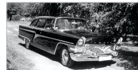
A Csajka volt az igazi „nagy, fekete autó”

A csúcskategóriát, a luxust, a fényt, a csillogást régen a Csajka, később a Zil képviselte. Ez a típus teszteltette meg azt a luxust, amit Amerikában a Lincoln teremtett meg limuzinjával. A nagy, nyolchengeres motorral szerelt Zileket a Szovjetunió magas rangú vezetőinek tartották fenn. Éppen ezért évente csu-