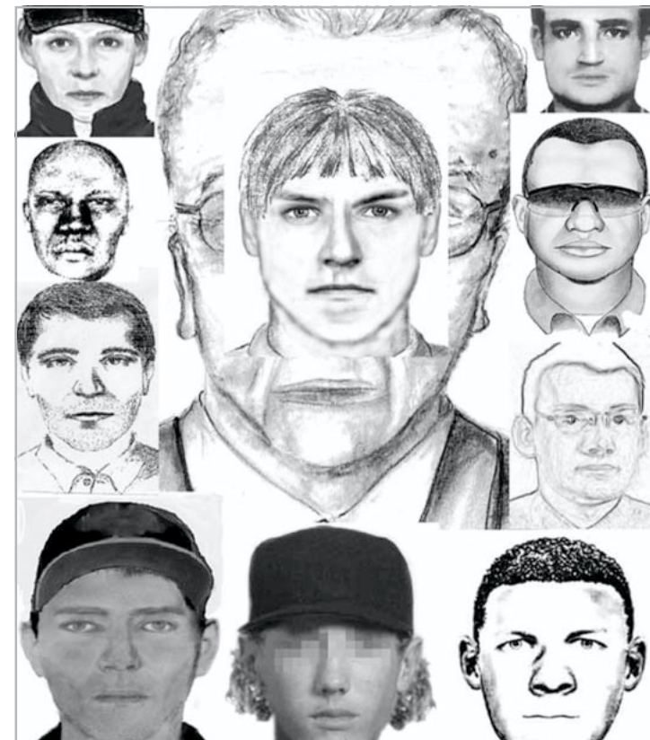
A MONTÁZST PAPP MÁRTON KÉSZÍTETTE

Hazánkban néhány évtizede rengeteg lopás történik, ez a szocializmus öröksége, de régen elsősorban a munkahelyről, és egyszerre kisebb értékeket tulajdonítottunk el. Jelentős magánvagyonok kevésbé voltak, így az ellene elkövetett bűncselekmények sem voltak annyira jellemzőek. Elsősorban a magán- és köztulajdon kárára elkövetett, ismertté vált bűncselekmények száma emelkedett a rendszerváltás óta. Hogy ez alól városunk és iskolánk sem kivétel, azt az elmúlt években történt sorozatos lopások egyértelműen jeleztek. De azok szinte minden esetben olyan magántulaj-