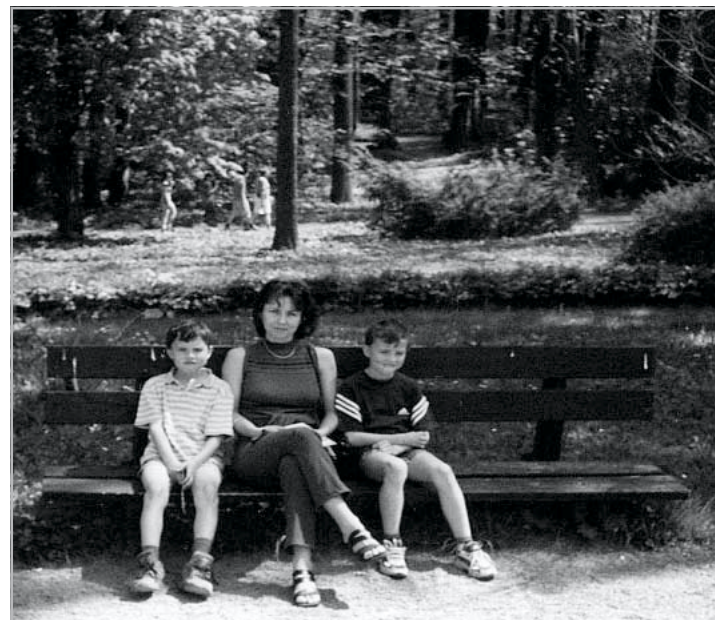
Két kislával a természetben