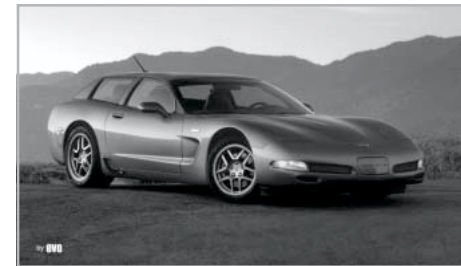
Fantáziám végeredménye: egy Corvette Sportwagon

Ezt persze legtöbbször nem engedheti meg magának. Éppen ezért egy autót kedvelő és emellett a számítógépekhez is jól értő csoport kitalálta, hogy miért ne lehetne végrehajtani egy autón ugyanolyan korrekciót, mint amelyet a divatfotósok végrehajtanak a lefényképezett modelleken, hogy még tökéletesebbé tegyék a címlapfotókra kerülő nőneműket. Így született meg a virtuális tuning fogalma. Egy hétköznapi képszerkesztő program segítségével az adott képen változtatásokat lehet végrehajtani, aminek eredménye akár egy tuningolt autó is lehet. Sokan – így én is – azért kedvelték meg ezt a műfajt, mert egy kis tanulás és némi időbefektetés árán egy átlagos autóból vérbeli tuningjargányt lehet fabrikálni. A képszerkesztő programok olyan változtatásokat is lehetővé tesznek, amelyekkel a valóságban nem létező, fesztiváldíjas tanulmányautók is készíthetők. Egy ilyen ötletéről mellélünk most képeket.