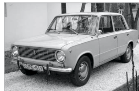
Az 1971. áprilisban Magyarországra érkezett első Zsiguli FOTÓ: NAGY TAMÁS (2004. MÁRCIUS 19.)

Palmiro Togliatti olasz kommunista vezetőről. A gyárral együtt az 1965-ös Év Autója címet kiérdemelt 124-es modell gyártási lehetőségét is eladták a szovjeteknek. A tervek szerint évente 660 000 darab gépkocsi gyártására készült a Volga-parti gyár. Magyarországra 1971 áprilisától érkeztek ezek az autók a KGST keretében, azaz Rába traktorokat és Ikarusz buszokat szállítottunk értük. Az „ezerkettes” kezdeti sikereit csak nő-