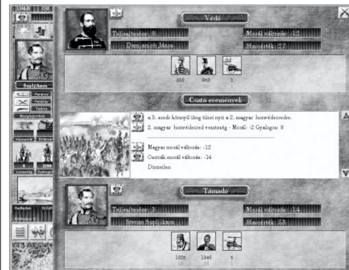
A KÉPEK AZ INTERNETRŐL SZÁRMAZNAK

A grafika persze legfeljebb átlagos, de legalább akármilyen gépen elfut a játék. Már talán kicsit kínos, amikor csak szöveges számlológó kapunk az űtkö-