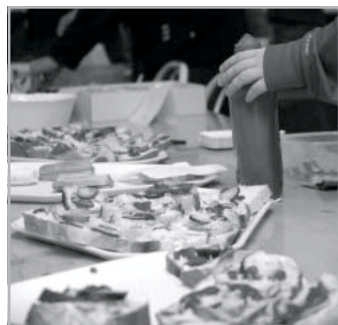
A büfé kitűnő volt, szokatlan, de szolid árákkal

testék, még füstköd is), volt különösen ötletes büfé széles és minőségi válasz-tékkal és baráti árákkal a 11.a osztály jövőtáblól. Az is dicséretes, hogy nem merült feledésbe a rendezvény farsan-gi jellege; a jelmezversenyen a legkiseb-bektől a legnagyobbakig számos csa-pat képviseltette magát. A jelmezkaval-