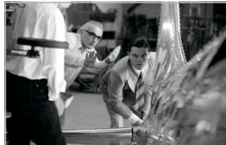
À LA BÁRDOS ❧ XVIII/1–2. 2005. január–február