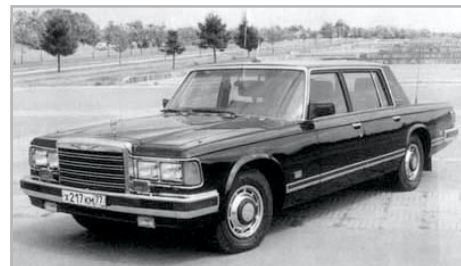
Zil a '80-as évekből

tel. Klasszikus terepjárója, a szovjet hadsereg köveltényei szerint tervezett, legendás UAZ 469. Ennek civilizáltabb – keménytetővel, hosszított tengely-