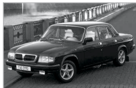
Egy Volga a XXI. századból

tel. Klasszikus terepjárója, a szovjet hadsereg köveltényei szerint tervezett, legendás UAZ 469. Ennek civilizáltabb – keménytetővel, hosszított tengely-