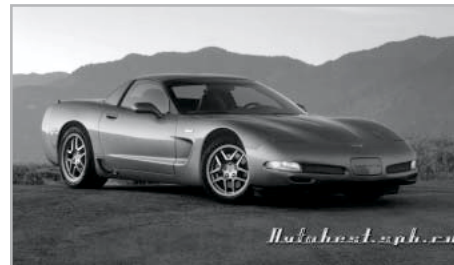
Kiindulási alap: egy Chevrolet Corvette

re, mind pedig az ezekért kifizetett borsos összegre. A külső tupirozásában fontos szerepet játszanak a nagy, különleges felnik a rajtuk feszülő peres gumikkal, a különféle karosszériaelemek, mint például az első