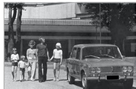
Szocialista idill az olajválság előtt az ezerötös Ladával

velni tudta a „cigánymerciként” ismert ezerötös, a „vasorrúnak” hívták ezerhatos, valamint a még ma is