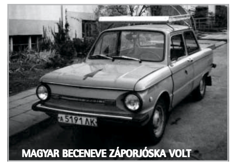
MAGYAR BECENEVE ZÁPÓRIJÓSKA VOLT

Minden kétséget kizárva a legsikeresebb, legjobb, legfényesebb utat bejárt „vörös” típus a Lada volt. A nálunk még mostanság is oly gyakran feltűnő márka története 1966-ban indult. Ekkor határozták el ugyan-is a Szovjetunióban, hogy egy olyan autógyárat kell az akkori ügynevezett „népgazdaság” termelésébe állítani, mely alkalmas a hatalmas területű és több száz milliós lakosságú ország és régió személygépkocsi-ellátottságának érezhető növelésére. Az oroszok a sikeres olasz autómárkát, a FIAT-ot hívták segítségül. A FIAT konzern alá is írta a megállapodást a szovjet