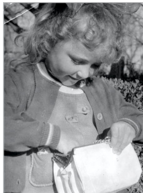
Vajon mit rejt a táská?

– Székesfehérvári vagyok, ott tanítottam egy gimnáziumban. Férjem miatt, aki tatai, ide költöztünk. '93 őszétől a Bárdosban és a Päch Antalban is tanítottam féllásban, és '94-től vagyok teljes állásban ennek az iskolának a tanára.