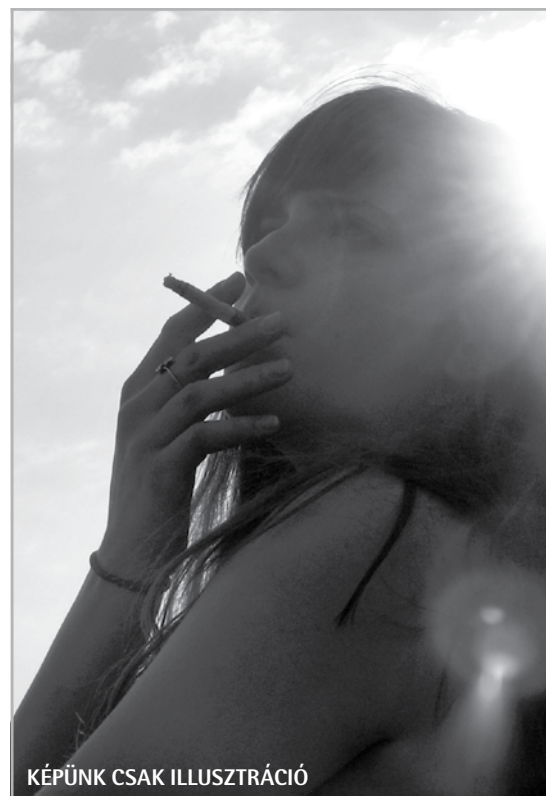
KÉPÜNK CSAK ILLUSZTRÁCIÓ

A fű nem vadkender, az ugyanis nem kábítószere, hanem hashajtó hatással rendelkezik. Leveleiknek megtévesztő hasonlósága okozott már nem éppen kellemes meglepetéseket. A füves