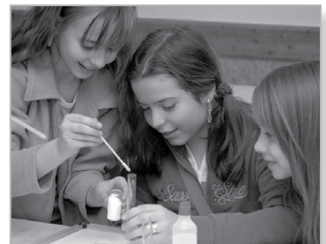
A kémia tanárok érdekes kísérleteket szerveztek

szati Múzeumba vagy a Turulhoz, jóllakhatott a reformkonyhán, felfrissülhetett a gyógyteaházban, természetfilmeket, díszmadarakat, hulladékszobrokat nézhetett meg, gyógynövényeket, könyveket, bélyegeket, ásványokat vásárolhatott. Pénteken ismerkedési esten vehetett részt egy retro buli keretében, amelyen azonban a vendégek és a bárdososok is csak igen csekély számban jelentek meg. A kezdeti passzivitás végül csak megtört, és mindenki jól érezte magát.