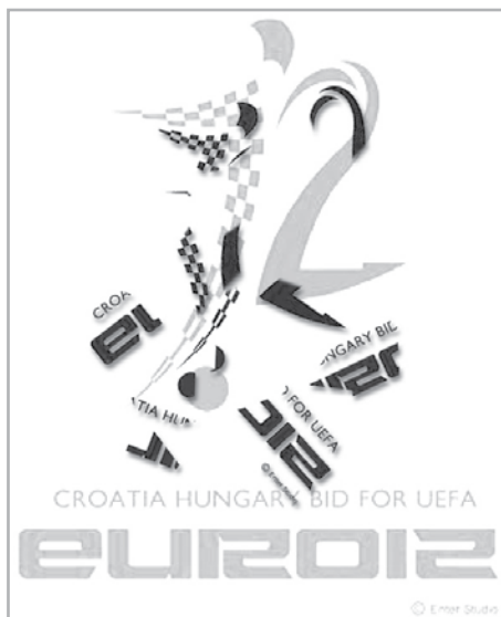
MONTÁZS: À LA BÁRDOS

Itt valaminek történnie kellett. A fogadóirodák szerint is a legesélytelenebb pályamunka győzött. A végeredmény, azt gondolom, önmagáért beszél, a csalódott fél akarva-akaratlanul is találgatásokba és kombinációkba kezd. Utólag ki lehet jelteni, hogy a háttérben már minden jó előre eldőlt. Pél-