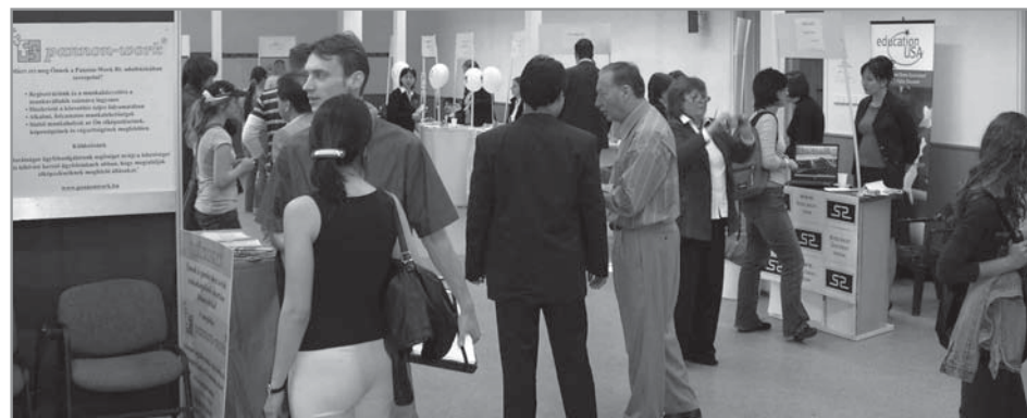
Régen álláshirdetés volt, ma karrieriroda HAT-NYOLC ÉVIG TANULSZ, HOGY ESÉLYED LEGYEN A KIVÁLOGATÁSRA

••••• Előadásokon egyébként általában ugyanaz az alapmag ül bent. Nekik jó eséllyel summa cum laude diplomájuk lesz.