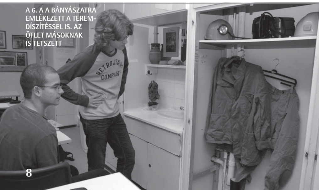
A 6. A Bányászatra emlékezett a teremdíszítéssel is. Az ötlet másoknak is tetszett

A TÁMOP 3.1.4. pályáztatása a tatabányai köznevelési igazgatóság irányul. Az emelt szintű érettségire felkészítő tanulóit közül tatabányai nyelvi és irodalmi műveket írtak. A pályázatunkban ezekből