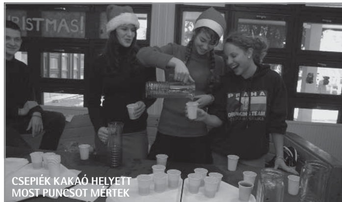
CSEPIÉK KAKAÓ HELYETT MOST PUNCSOT MÉRTEK

tábol mindenki megkóstolhatta a karácsonyi (alkoholmentes) puncsot – ennek kínálása már hagyomány-