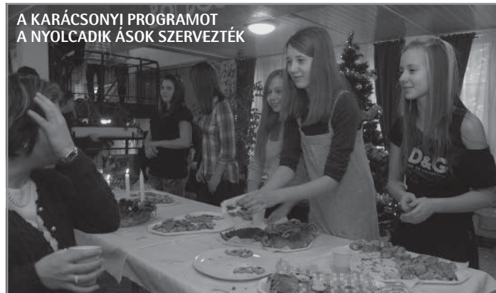
A KARÁCSONYI PROGRAMOT A NYOLCADIK ÁSOK SZERVEZTÉK

December 19-én kicsit megpróbáltuk enyhíteni azt a csalódást, amit