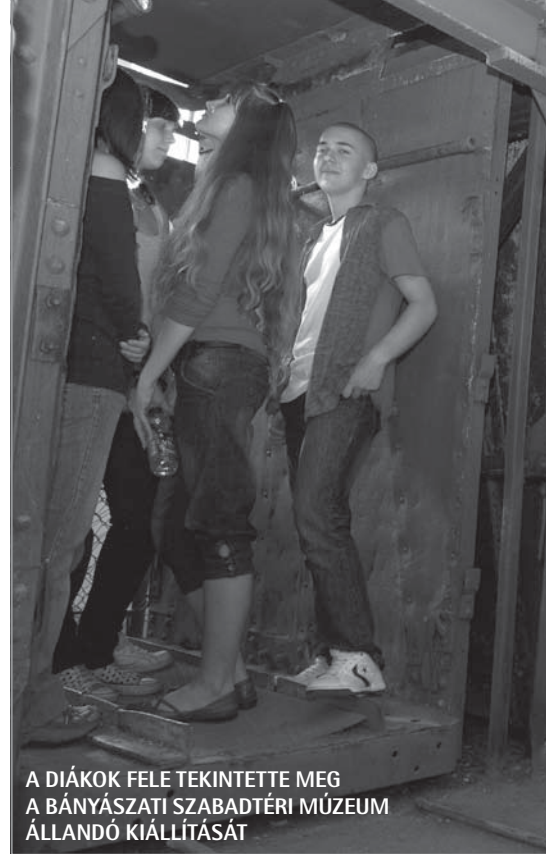
A DIÁKOK FELE TEKINTETTE MEG A Bányászati Szabadtéri Múzeum Állandó Kiállítását