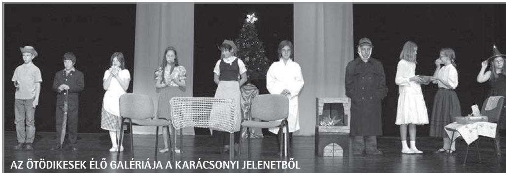
AZ ÖTÖDIKESEK ÉLŐ GALÉRIÁJA A KARÁCSONYI JELENETBŐL