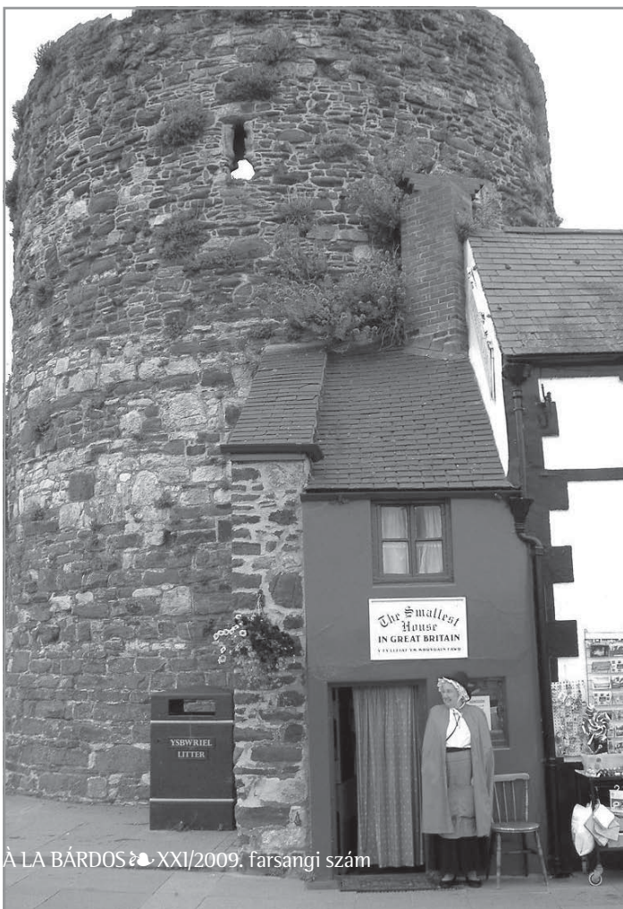
Á LA BÁRDOS • XXI/2009. farsangi szám

A következő napon reggel már utaztunk is Conwy várába. Minden bástyába csigalépcsőn mentünk fel, így mire kiértünk a várból, mindenki leadott néhány plusz kilót. Még aznap megnéztük Nagy-Britannia legkisebb házát, amely kétemeletes, de az alsó szint kb. 160 cm, így mindenkinek behúzott nyakkal kellett bemennie. Mint minden további