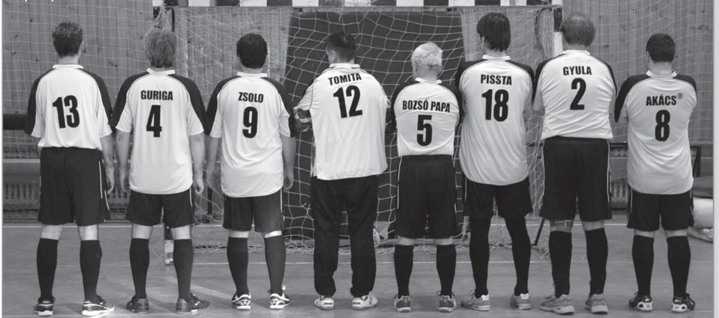
Csapatkép bánkis módra