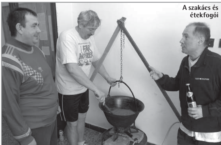
A szakács és étkefgőji