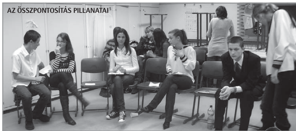
AZ ÖSSZPONTOSÍTÁS PILLANATAI