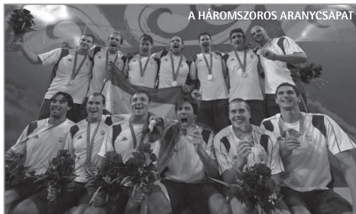
A HÁROMSZOROS ARANYCSAPAT

A magyarok is sok rekordot döntöttek meg, de ezek nagy része sajnos negatív rekord. Már a magyar résztvevők száma (174) is az utóbbi évtizedek legalacsonyabbja, de azt