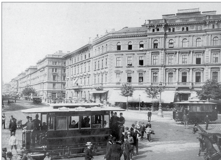
Villamosok haladnak az Oktogonon, a nagykirályi út és Andrássy út keresztesződésében

Vizont erre a két cég előzetesen számított, ezért megállapodást kötöttek, hogy ha nem engedélyezik a felszíni vasút építését, egy földalatti vasút létesítését fogják kezdeményezni. Terveket készítettek a Siemens Et Halske céggel, melyek szerint a városligeti fürdőtől a Vigadóig egyajtós, de háromosztatú szerelvények köz-