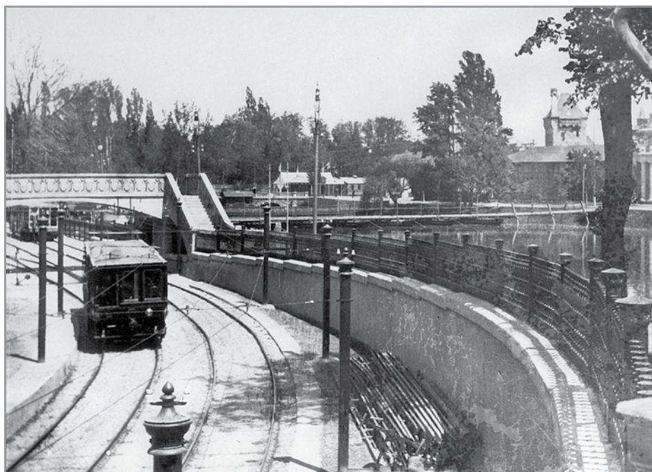
A földalatti vasút eredeti nyomvonalán hamarabb kibújt a föld alól, a Városligetben

Az építkezés az engedély megadását követően azonnal megkezdődött. A vasút kivitelezését a tervező Siemens & Halske cégre, a különböző szerelési munkálatokat pedig Wünsch Róbert budapesti vállalkozóra bízták. Az építésvezetői posztra pedig Vojek Ödönt jelölték ki. Az állomásokat burkoló barna és fehér csempék elkészítésére pedig a Zsolnay gyárat kérték fel. Rengeteg ember munkálkodott a gigászi beruházáson, amely 6 méter széles és kb. 3,3