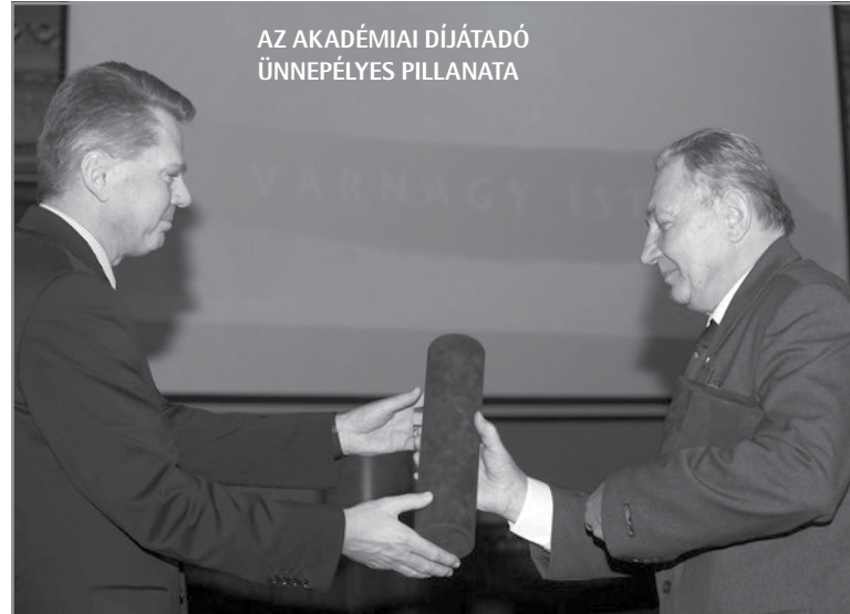
AZ AKADÉMIAI DÍJÁTADÓ ÜNNEPÉLYES PILLANATA

☛ Kevesen tudják a tanár úrról, hogy tudományos munkát végzett, több tankönyv szerzője is volt.