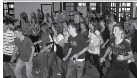
A táncmozdulat azonos, a vélemény különböző

Az új diákok már csak hírből ismerhetik a fél nyolcas kezdést. A régiak közül páran visszasírják, néhányan hálálkodva teszik össze a kezüket, a többiek pedig vállrángatva állnak a dolog előtt.