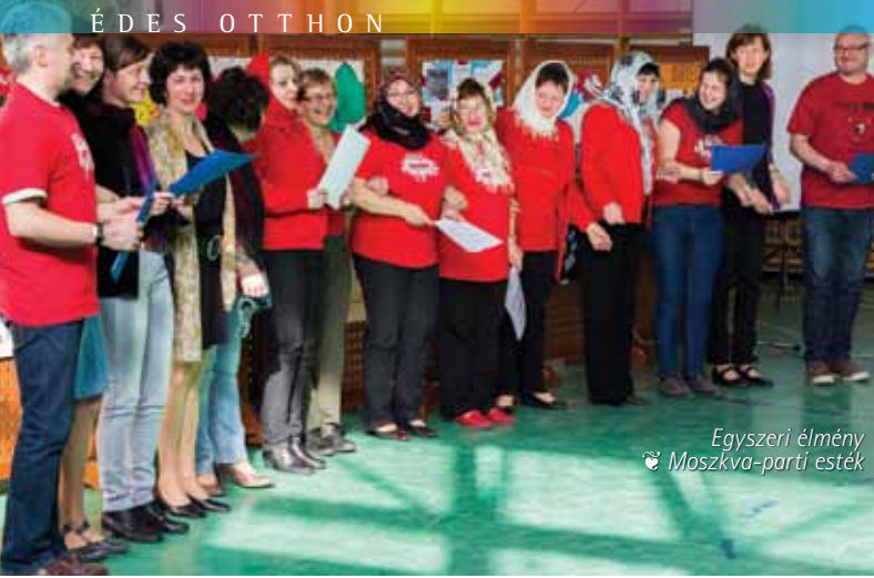
Egyszeri élmény Moszkva-parti esték

bonyolult kapcsolatrendszerét is bemutatta. A több mint százfős hallgatóság hálás figyelemmel fogadta az érdekes gondolatokat.