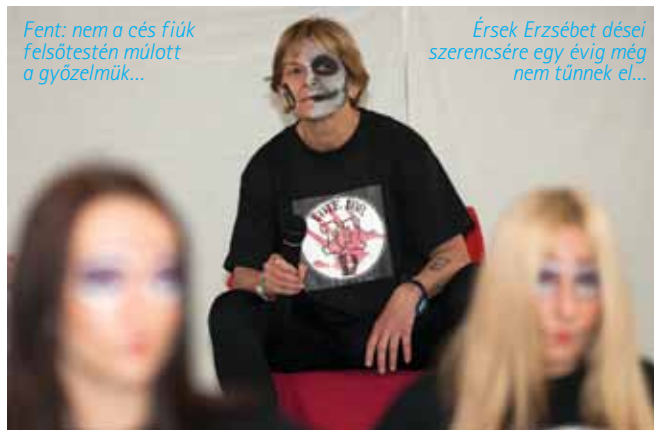
Fent: nem a cés fiúk felsőtestén múltott a győzelmük...

a felelősek; a dések idén ugyanis egy páratlan horrorsztorival nyugtázták le a közönséget. A démoni társaság vezetője pedig nem más volt, mint Érsek Erzsébet tanárnő, aki irigylésre méltó