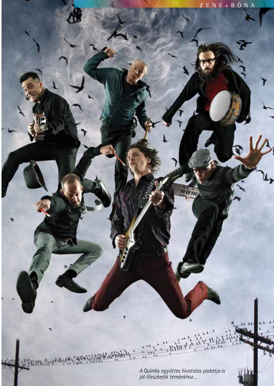
A Quimby együttes hivatalos plakátja is jól illeszkedik témánkhoz...

A Kispál és a Borz De szeretnék kezdetű dala vezet el minket a két zenekar következő nagy kérdéséhez: az ember számára megközelíthető-e a transzcendencia? Az emberi élet során ennek a megtapasztalására kevés esélyt látnak a korábban említett mesterséges mennyországok kivételével. A pokolba való alászállásnak nagyobb az esélye, de ha az ember az eget ostromolja, sokszor csalódnia kell: „Ahol a halál parfümillatú, / pokolra hív a randevú” (Quimby: Libidó). „Ha az ember jó társaságban van, akkor az időjárás kivételével semmi másról nem be-