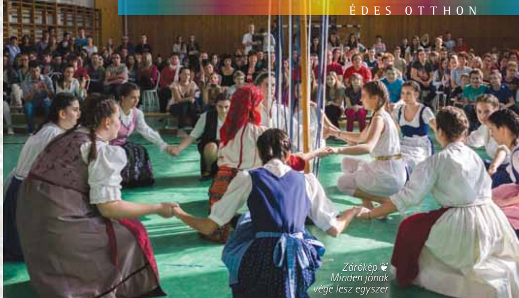
Zárókép Minden jónak vége lesz egyszer